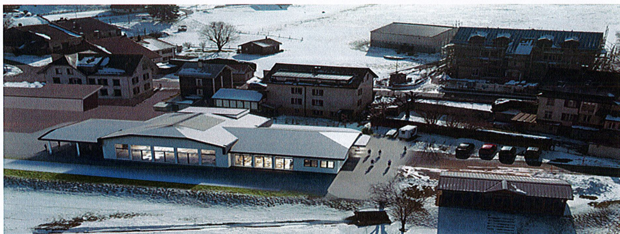
Ancien projet retenu pour le Complexe du Brenet

À la suite de cette présentation, vu le coût du projet et sa conception régionale, il a été décidé de le traiter par une commission inter-municipalités, dans le but de finaliser sa conception, sa gestion, son financement et sa réalisation respectant les procédures des marchés publics.