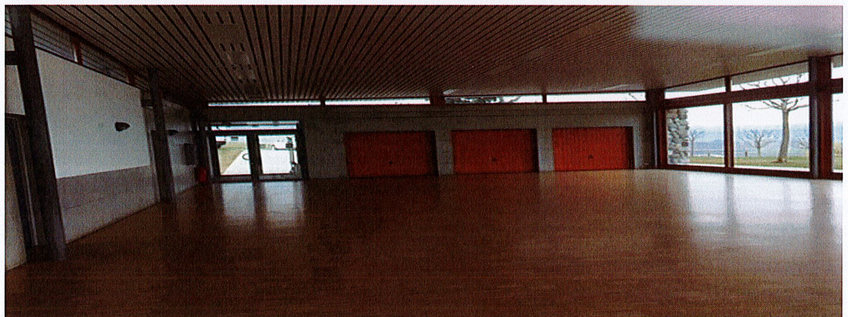
Genre de salle envisagée (salle de Treycovagnes)